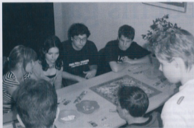
De leerlingen vinden het een leuk en leerzaam spel.

vragen over het Bourgondische Rijk van Philips de Goede stonden wat minder op het netvlies.