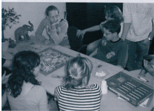
Havo 3B-leerlingen van het Strabrecht College speelden het Grote Geschiedenis spel met vier groepjes van twee.

kaartjes, op hun beurt weer verdeeld over de tien tijdvakken en een overzichtstijdvak; er kan op verschillende wijzen mee gespeeld worden.